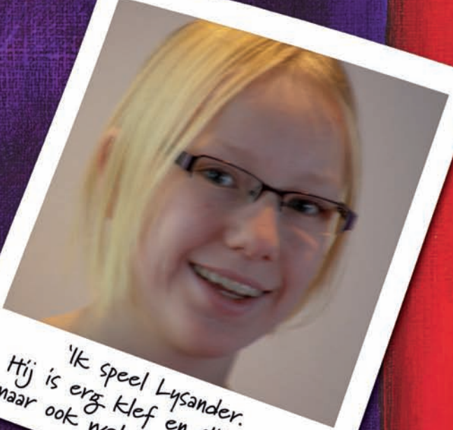
'Ik speel Lysander. Hij is erg klef en slijmerig, maar ook wel leuk.' (Maaïke)